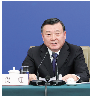
住房和城乡建设部部长倪虹