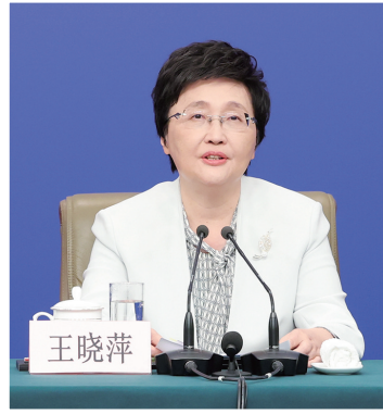
人力资源和社会保障部部长王晓萍