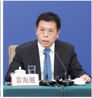
国家卫生健康委员会主任雷海潮