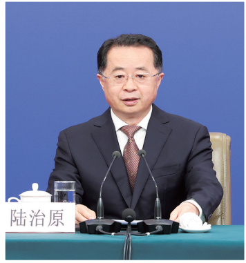
民政部部长陆治原