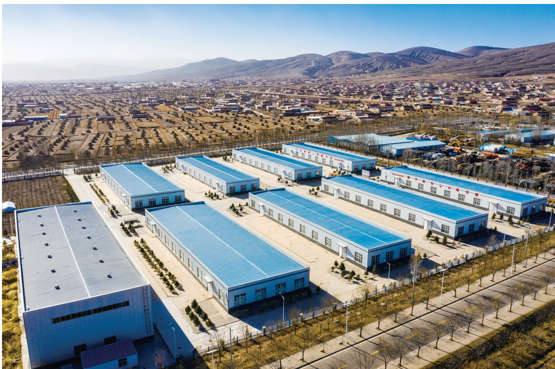
扶贫车间让群众实现家门口就业。