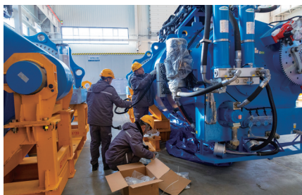
中国中车项目现场热火朝天,助力海原县在工业现代化道路上大步迈进。

田兴仁,宁夏摄影家协会会员,摄影作品和视频作品获得自治区和市、县级奖项,拍摄的海原县照片和视频,多次被央视、宁夏本地媒体采用。曾担任 CCTV10《中国影像方志》海原篇航拍飞手等。