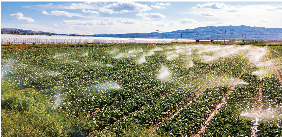
大片冷凉蔬菜田整齐排列,嫩绿的菜叶在风中轻舞。

从田兴仁的航拍照片中,能清晰地看到海原县在生态环境上的改善。曾经连绵起伏的荒坡秃岭,如今披上了葱郁绿装。抬头仰望,蓝天白云已成为天空的日常标配,澄澈的天空下,是愈发美丽宜居的家园。每一张精心拍摄的照片,都是海原县发展的直接见证,更是黄土地迸发的时代强音。