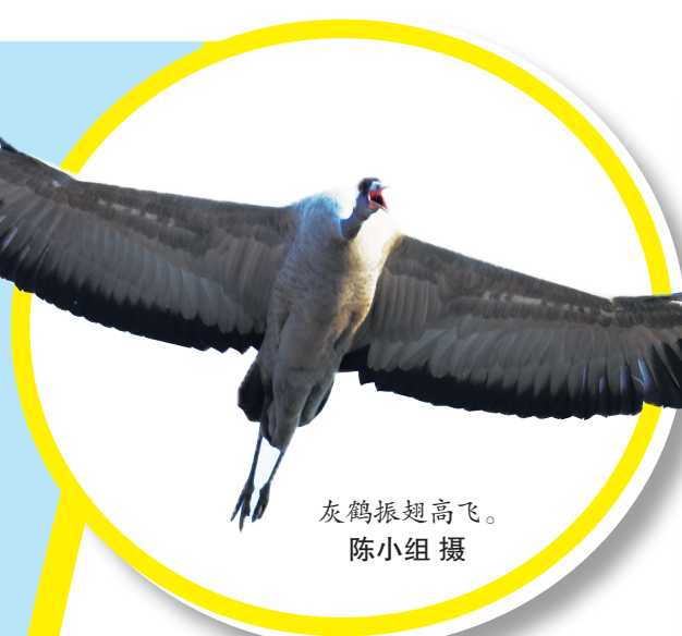
灰鹤振翅高飞。

弓着腰，目视前方，借助半人高的蒿草慢慢接近，300米、200米……这不是特种兵作战，而是追鹤人的标准动作。