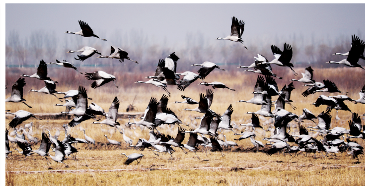
灰鹤在田野中起飞。