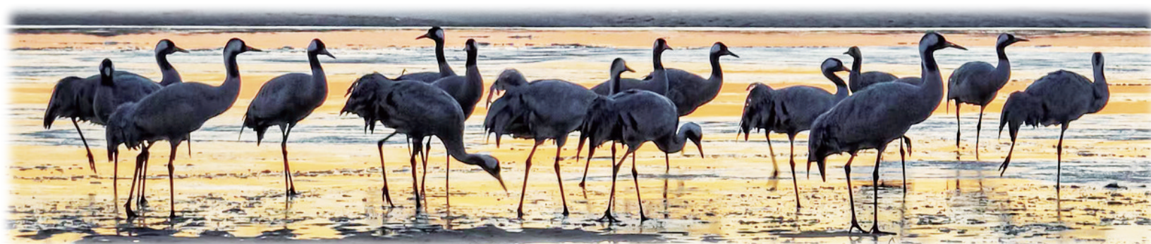
灰鹤在觅食。