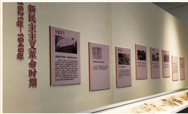
王孜逸/文 杨开鑫/图