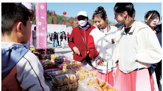
特色小吃展区吸引游客驻足。

当美食与美景相遇,当文化与生态融合,一场别开生面的文旅盛宴就此展开。5月1日,第二十一届宁夏六盘山山花节暨“山花烂漫时·泾源等你来”农文旅促消费(特色美食大赛)系列活动在固原市泾源县胭脂峡景区举办。从特色美食大赛到贴心的旅游服务,从森林健康跑到乡镇集市的烟火气,泾源县以多元化的活动形式,展现了其独特的魅力与发展活力。