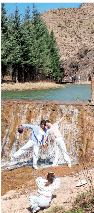
游客在泾源县胭脂峡景区拍照打卡。

5月2日,香水镇太阳村举办“香水蜜源”花间好物农文旅促消费活动,通过“美食+体验+展销”模式引流,单日游客超1100人次,以沉浸式乡村体验游激活消费新动能。