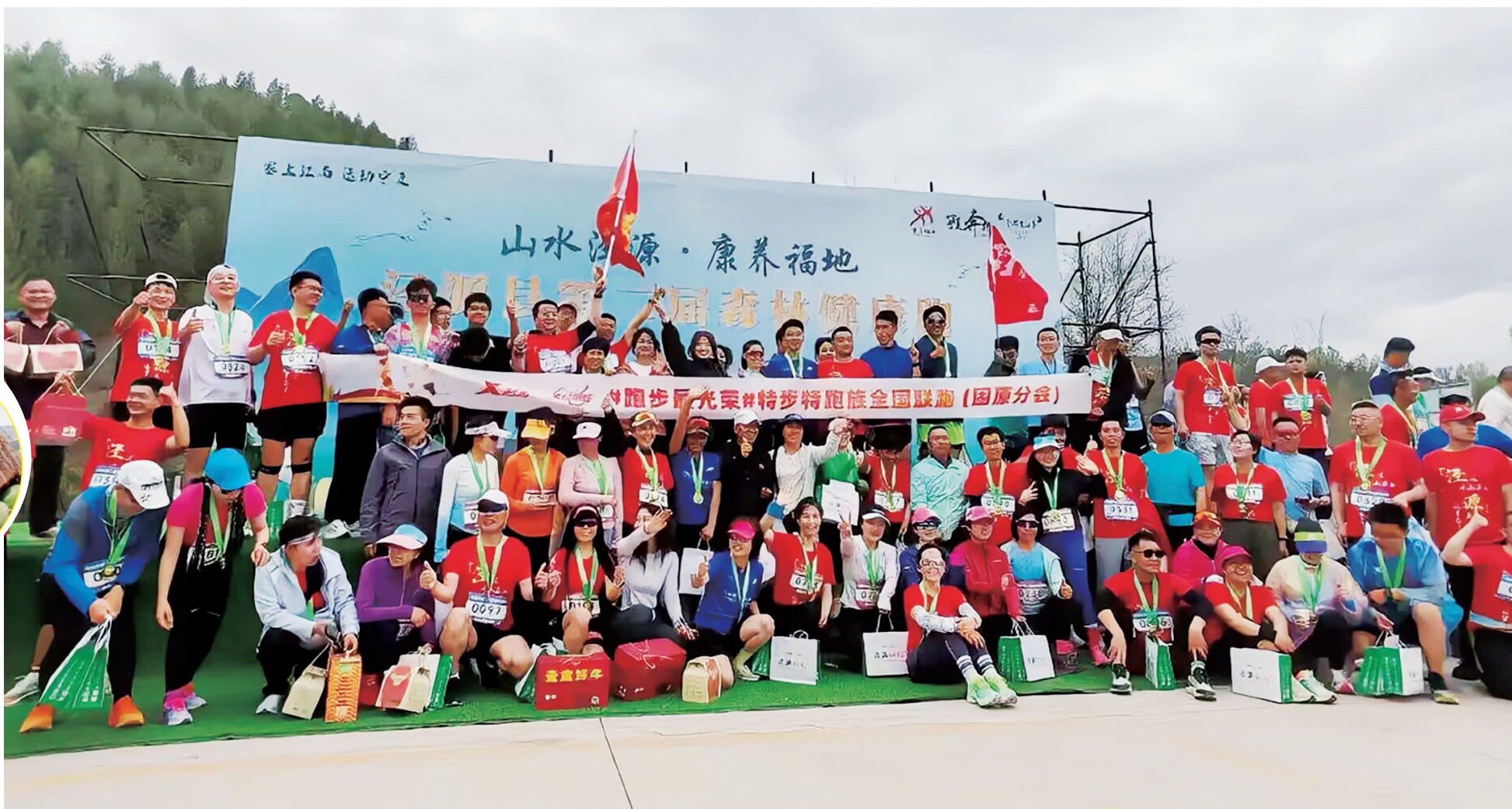
2000余名跑友参加泾源县第二届森林健康跑。