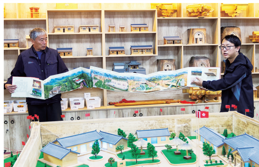
展示红色六盘。