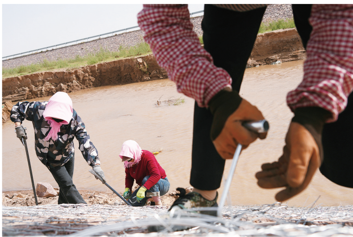
守护清水河。