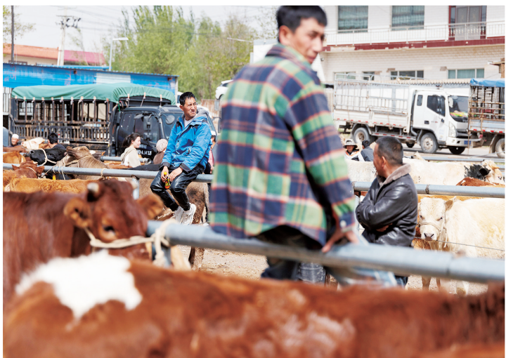
固原市原州区三营大集上卖牛的商贩。