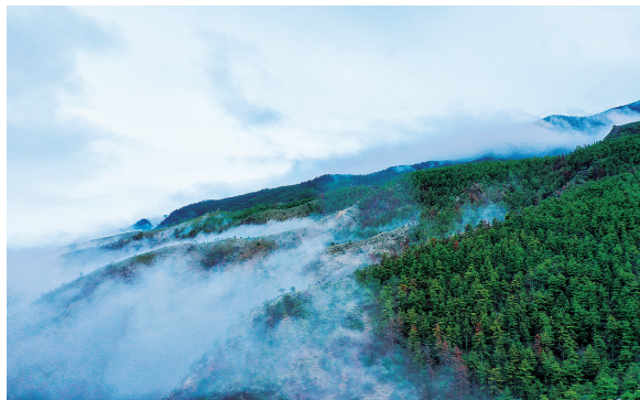
贺兰山云雾弥漫。