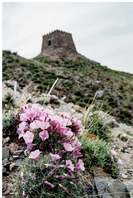
山花烂漫。

贺兰山的壮美风光不仅是大自然的慷慨馈赠，更是生态保护成果的生动体现。近年来，宁夏不断加大对贺兰山生态环境的保护力度，通过封山育林、禁牧禁猎等一系列措施，使贺兰山的生态环境得到了显著改善。如今，贺兰山正以其独特的魅力，吸引越来越多人前来领略它的壮美风光，感受大自然的神奇与伟大。