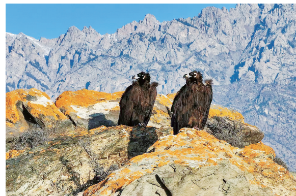
贺兰山山顶上，秃鹫正巡视四方。