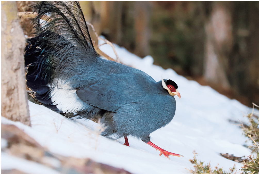
雪后，蓝马鸡在林中觅食。