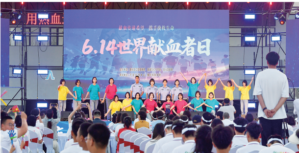
世界献血者日宣传活动现场。

在6月14日第22个世界献血者日来临之际,让我们走近无偿献血人,听听他们的献血故事。