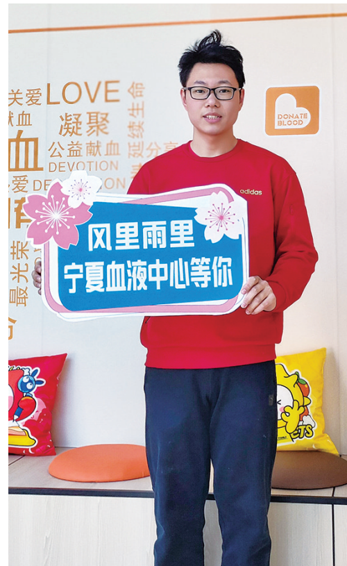
行硕为无偿献血打call。