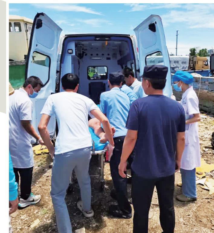
获救者被送上救护车。