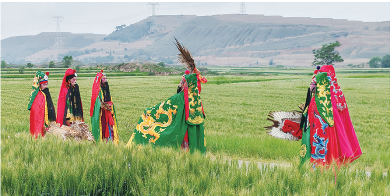
安万秦腔剧团演出期间,西吉县还组织了议程官说春词活动。