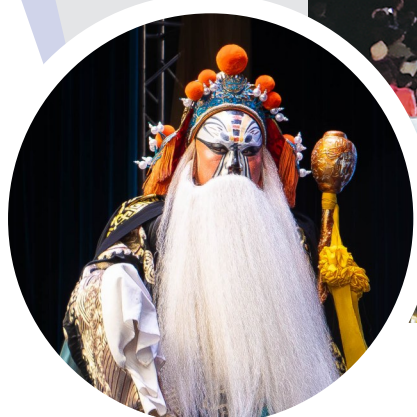
安万秦腔剧团演出经典剧目《忠保国》。

6月22日至26日,“寻找安详·戏韵秦腔”展演在西吉县激情唱响,安万秦腔剧团160余名演职人员在西吉县篮球公园体育场连唱12场大戏,来自周边多地乃至外省区的戏迷纷至沓来,共赴这场秦腔文化盛宴。