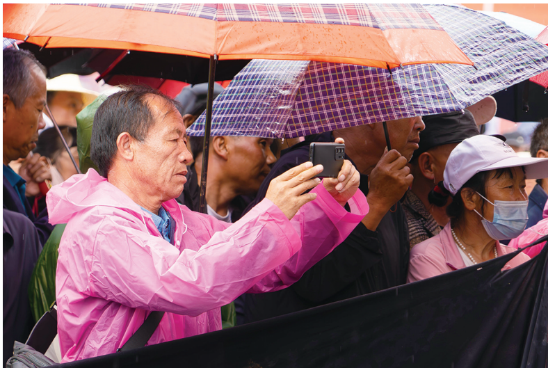
戏迷冒雨看安万秦腔剧团演出。