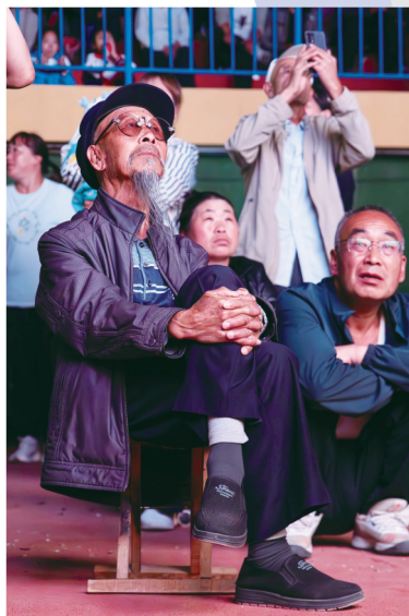
戏迷通过大屏幕看得投入。