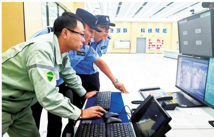
检查重点企业安防情况。

当晚，银川公安雷霆出击，全面开展夏季社会治安检查宣防集中统一行动，用警灯闪烁护航“夜经济”，用实际行动守护“烟火气”。1031名警力、861名群防群治力量迅速集结，一场全方位、立体化的集中检查宣防行动全面铺开。学校医院、繁华商圈、车站等重点部位和人员密集场所，一支支由巡特警、派出所民警组成的巡逻队穿梭其中。“步巡+车巡”“定点巡+流动巡”“实兵巡+视频巡”多种巡逻方式相结合，织就了一张严密的巡逻防控网。