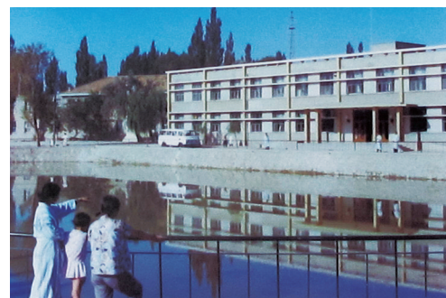
1977年7月,宁夏医科大学总医院一角。