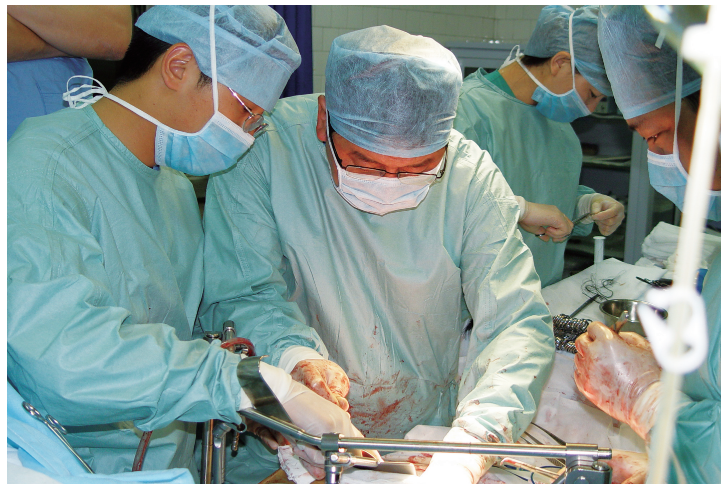
2003年,手术室里的工作场景: