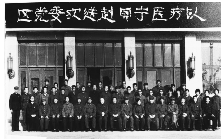
1978年,第1批援助非洲贝宁医疗队队员合影。