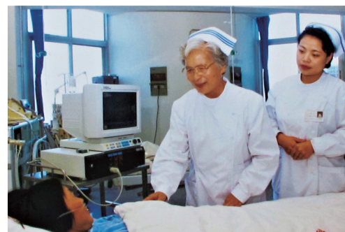
上世纪80年代的女医务工作者。