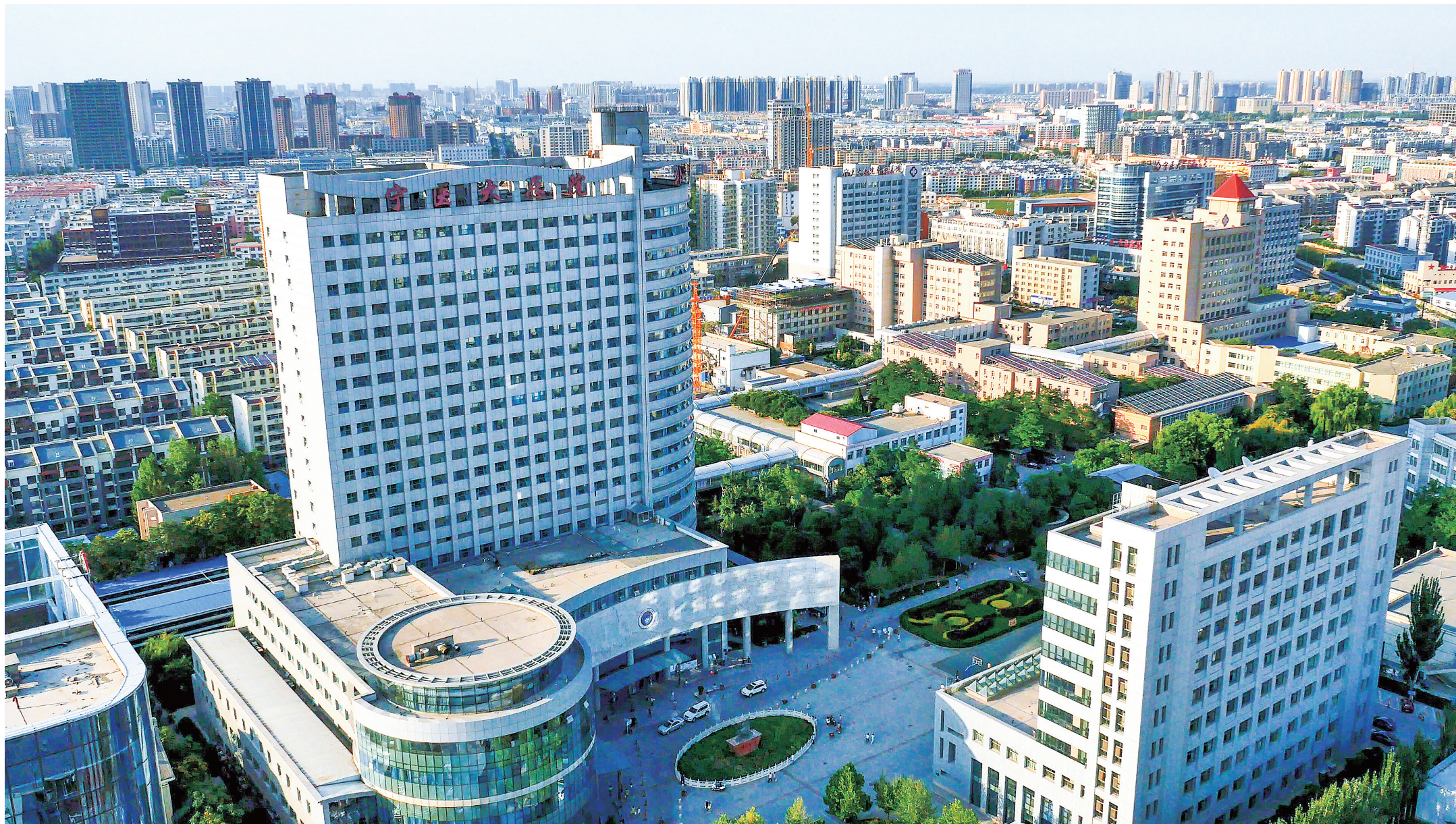
2025年,俯瞰宁夏医科大学总医院。