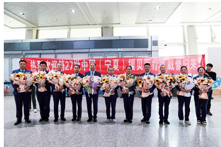
2025年,第27批援助非洲贝宁医疗队队员合影。