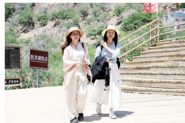
约上好友，一起爬山。