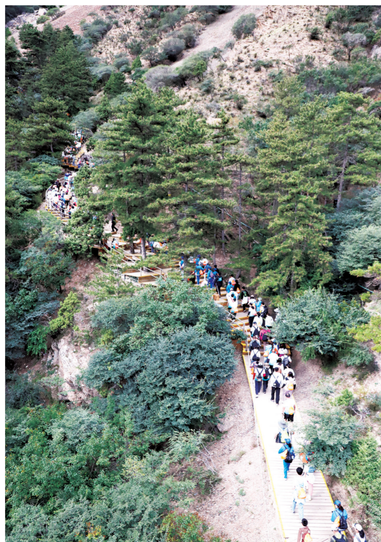
趁阳光正好，去爬山。