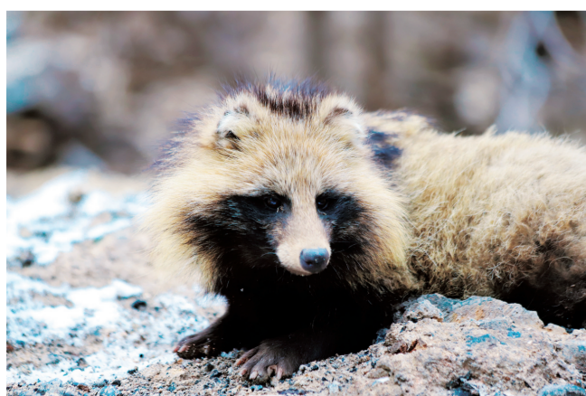
貉，在贺兰山难得一见。