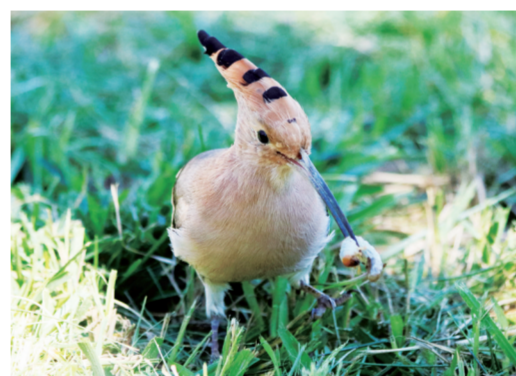
早起的鸟儿有虫吃。