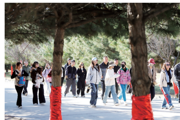
穿梭在林间的游客。