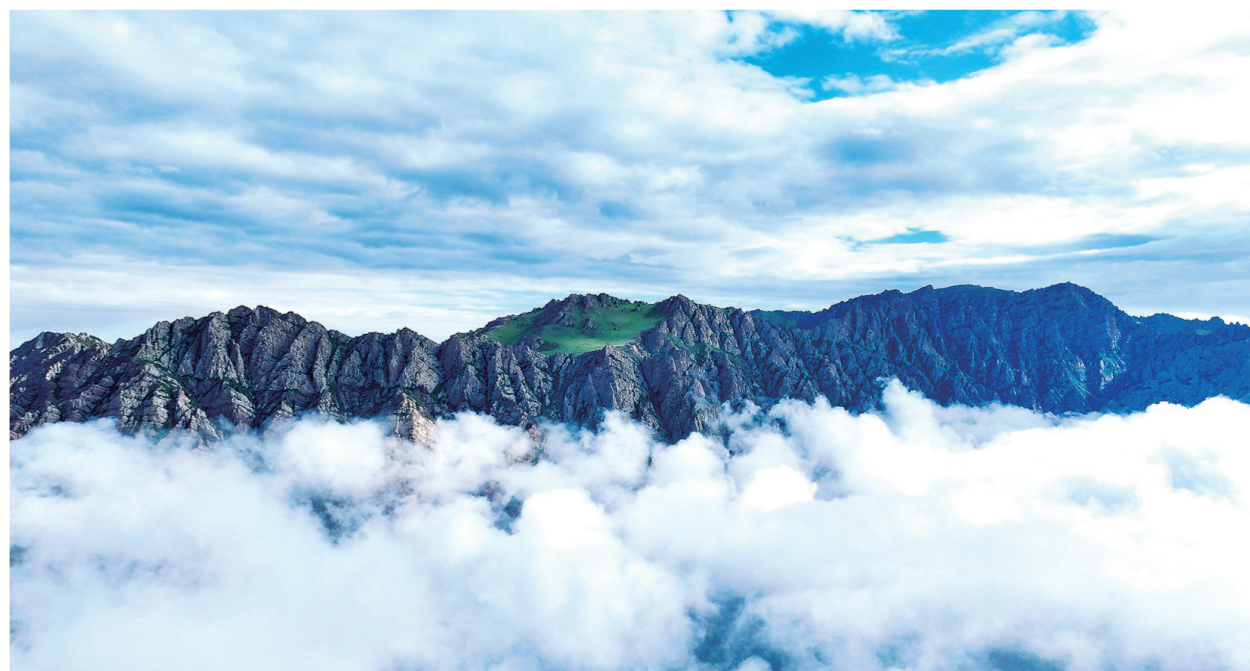
云海翻涌，美不胜收。