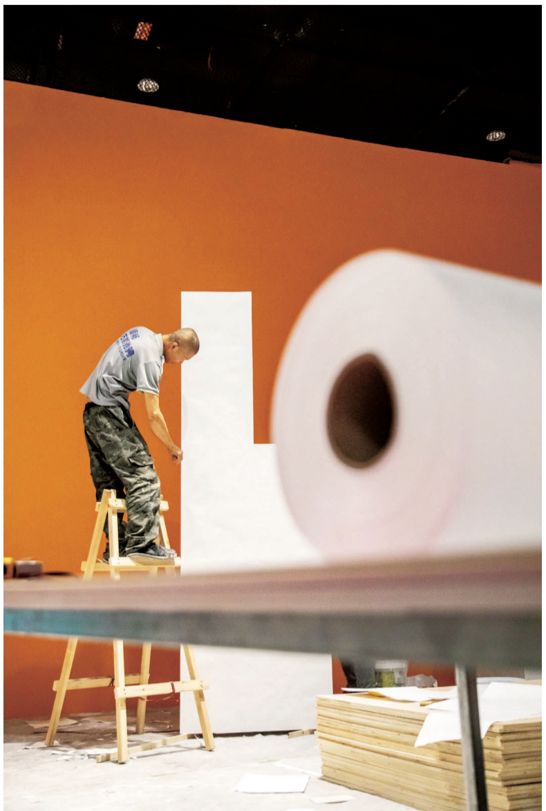
工人为《折叠城市》作品粘杜邦纸，纸卷与工人制作的结构恰好组成数字「101」。

黄雅晨 宁夏摄影家协会会员，2023年策划的公共艺术项目《2023影像日记》获2023年度文化和旅游部全国美术馆优秀公共教育项目提名；2023年摄影创作《镜头下的新农村》获《国家艺术基金2022年青年艺术创作人才-摄影创作》项目资助；2023年作品《新农村》入选第五届中国浙江(大运河)国际摄影大展。