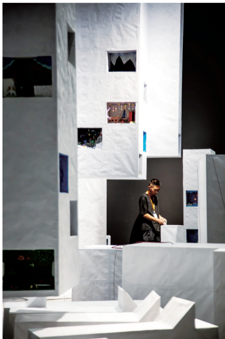
工人为儿童艺术作品《折叠城市》接电线。