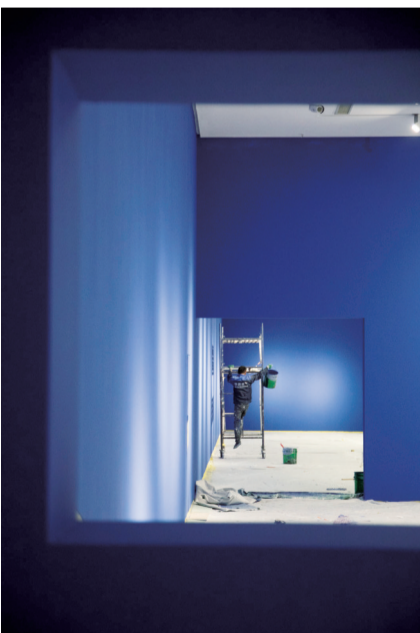
画面借框景构图，呈现展厅内施工场景。

将这些瞬间定格呈现，邀请观者穿透展览的最终形态，触摸艺术背后的协作温度与创造本真，读懂“未完成”的价值——它不是残缺，而是充满可能性的开始。