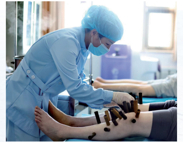
在自治区中医医院暨中医研究院风湿病科，医护人员为患者做药物竹罐治疗。

目前，银川市农业农村部门已启动联动机制，加强与气象、水利、应急等部门会商，密切跟踪天气与墒情变化，强化灾害性天气的预测、预报和预警。同时，通过广播、微信、互联网等渠道，第一时间向农户发布预警信息和简明防灾技术，确保群众早知晓、早防范。