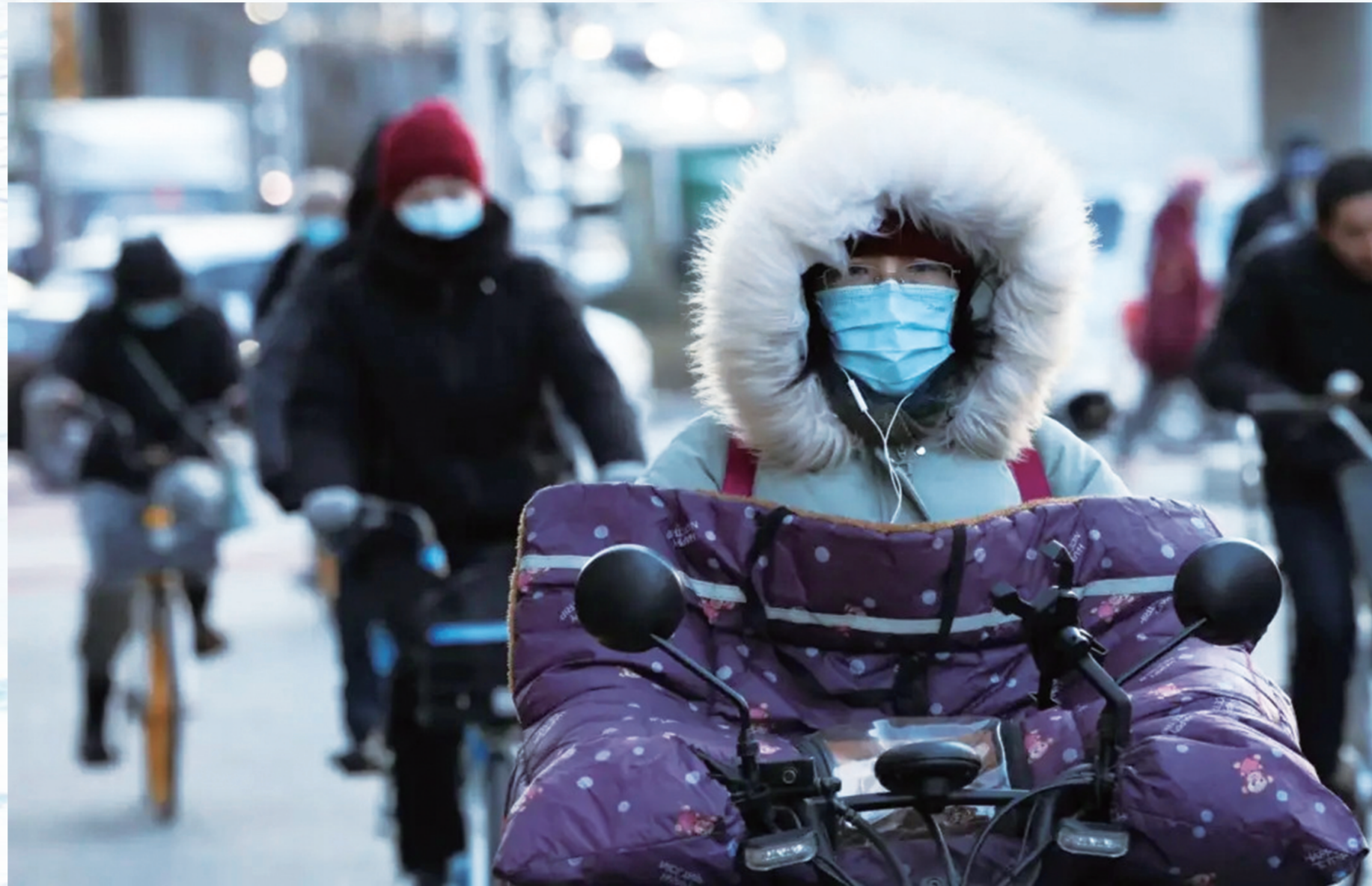
气温骤降，市民出行需做好防风防冻措施。

从异常偏暖到气温骤降，天气正在上演一场“冷暖大逆转”。王素艳提醒公众，冬季气候本就冷冷暖暖、起起伏伏，建议大家密切关注最新天气预报，及时增减衣物。