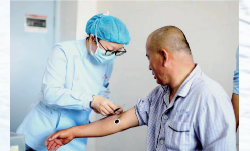
医护人员为患者进行穴位贴敷治疗。