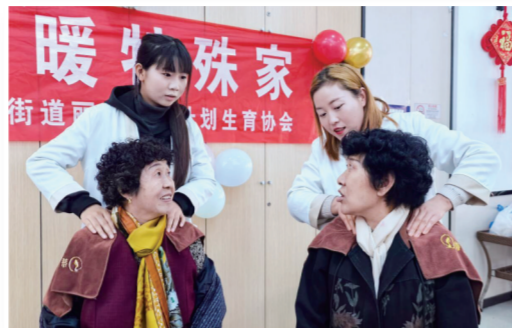
颈肩按摩志愿服务。