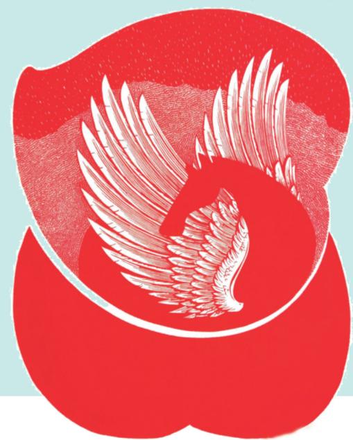
谭浩楠作品《天之德》