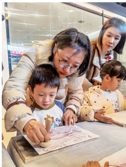
小朋友在妈妈的帮助下给版画上色。

1月18日至2月28日，由宁夏美术家协会主办、宁夏美术家协会版画艺术委员会和宁夏大学美术学院协办的“骏启新岁·宁夏生肖版画迎春展”，在银川市金凤区阅彩城4楼公共艺术展区展出。此次展览把画展搬出展览馆，走进繁华商圈，共展出来自宁夏各地的110幅优秀版画作品，现场还设置了版画工坊，加入体验版画制作环节，让更多市民零距离了解、欣赏、感受版画艺术与众不同的魅力。