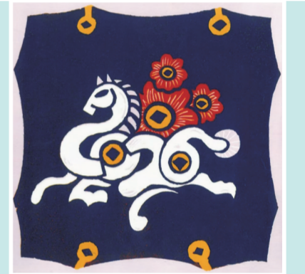
张雪丹作品《白驹贺岁》