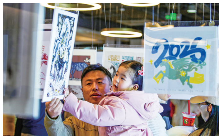
版画挂在空中，好看又好玩。