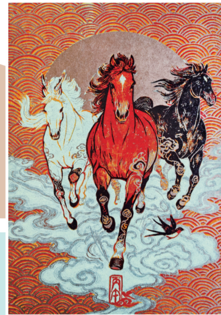
马荣作品《骏腾宏图》