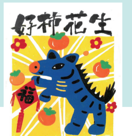
张奕璇作品《小马贺岁——好柿花生》