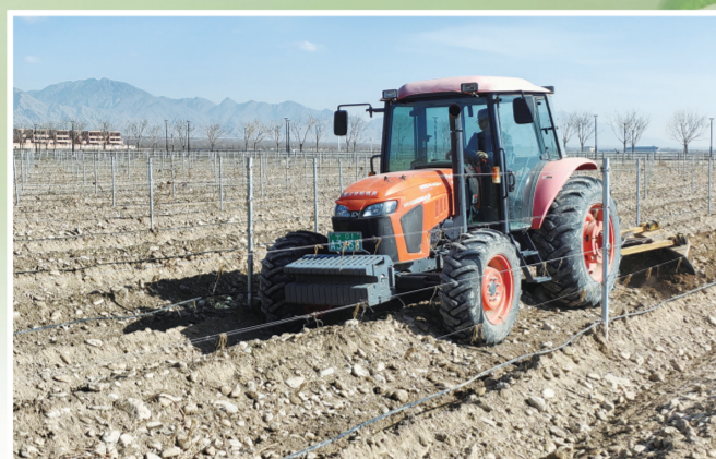
拖拉机带动出土犁完成两遍刮土。

作为世界公认的酿酒葡萄黄金种植带,贺兰山东麓的每一株葡萄藤,不仅承载着全年丰产的期待,更串联起现代农业、科研育种与乡村振兴的多元图景,在北纬38度的阳光里,孕育着属于宁夏的“紫色传奇”。