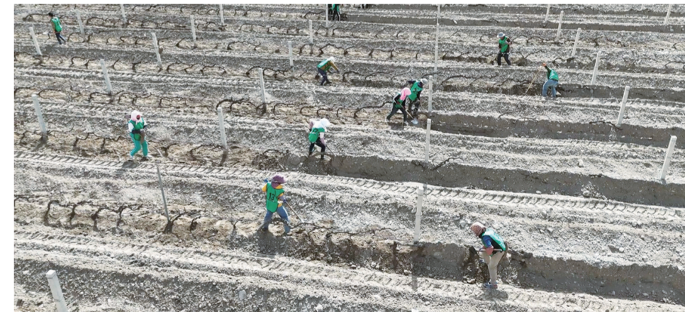
田间展藤劳动技能竞赛。